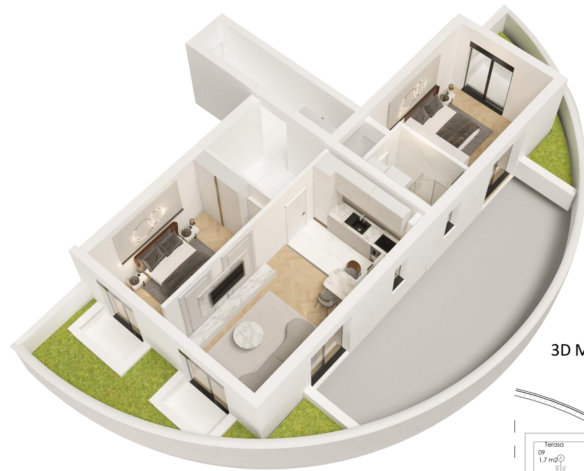
3D MODEL STANA

- OSNOVA DESETE (X) ETAZE STAN br. 148 - L2-X-D3